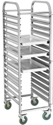
Estantes de refrigeración