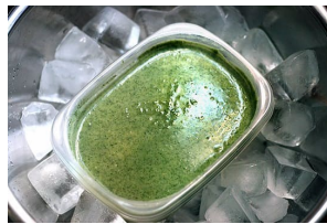
Baño de hielo