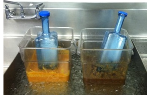
Sistema Ice Wand