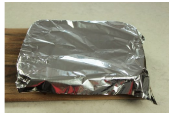
Cubrir mientras se refrigera